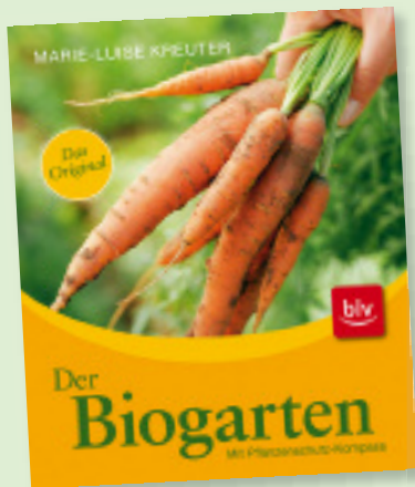
1 Buch neu