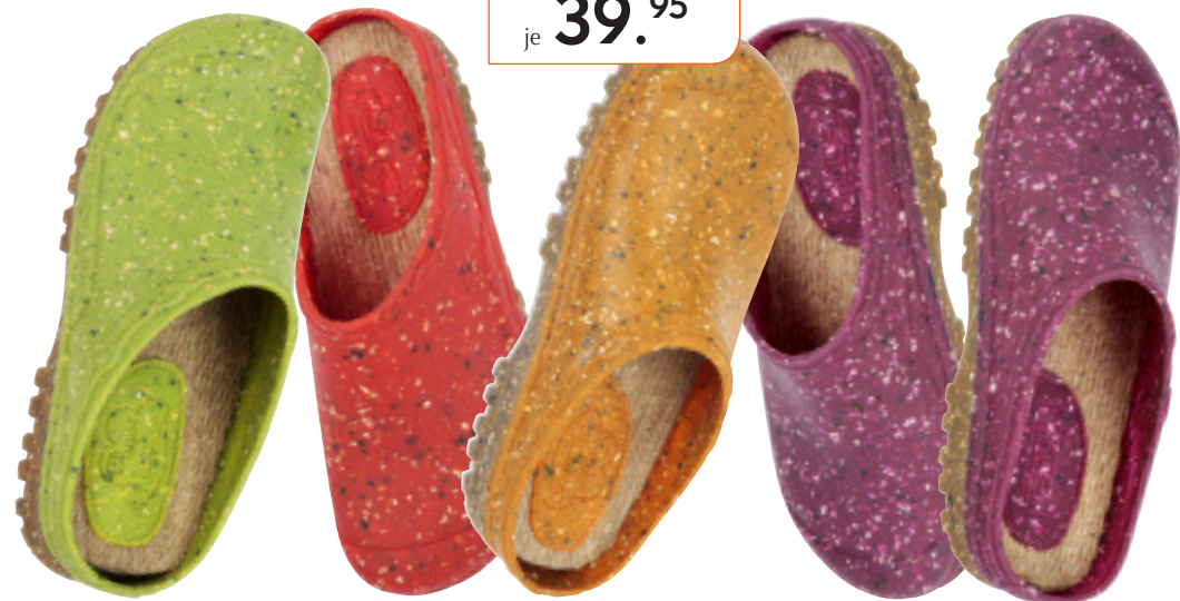
maigrün tomate calendula blaubeere brombeere