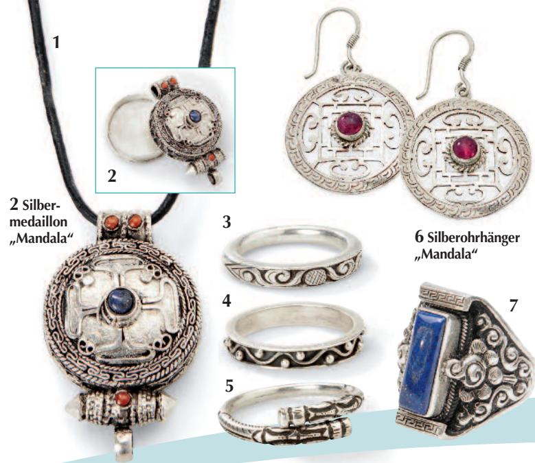
2 Silbermedaillon „Mandala“

Genießen Sie das Gefühl, etwas Einzigartiges zu tragen! Edlen Design-Schmuck aus heimischen Manufakturen. Bezaubernde Unikate von einem anderen Kontinent. Immer faszinierend, immer ethisch und immer zum fairen Preis. Das macht den Schmuck bei Waschbär so wahrhaft einzigartig!