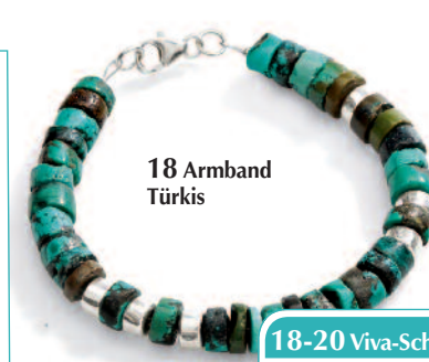
18 Armband Türkis