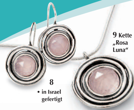
9 Kette „Rosa Luna“