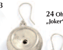
24 Ohrhänger „Joker“