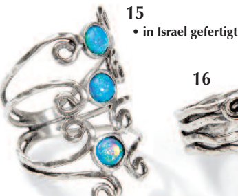
15 • in Israel gefertigt