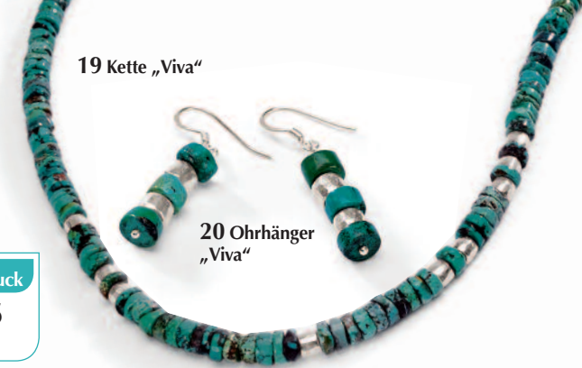
19 Kette „Viva“